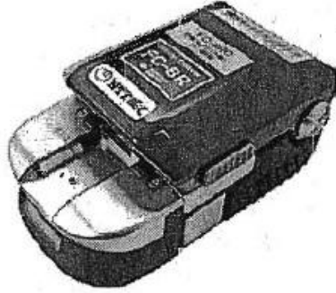
光ファイバカッター

の声を励みに、日々業務に取り組んでいる。同社アースでは、専門スタッフが現場で抱えているトラブルや課題の解決に向け、相談を受け付ける。