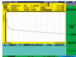
フェルール端面に汚れが付着した波形