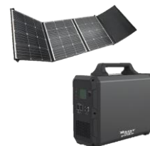
ポータブル電源 いざという時のための非常用バックアップ