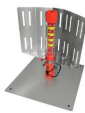
REC' sフラッシャー 工事現場等で歩行者や車からの 飛び込みを防ぐ警告灯