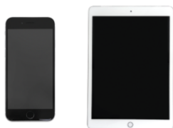
iPhone/iPad リユース品を活用レンタルと してご提供