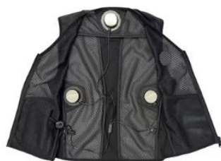
冷暖ベスト 過酷な現場作業の 暑さ/寒さ対策