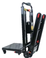
折り畳み電動のぼれる台車 重量物を積んで階段をそのまま 昇り降りできる電動台車