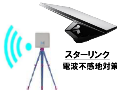
スターリンク 電波不感地対策