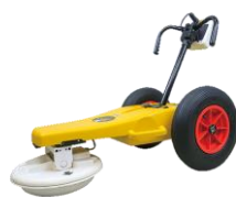
地中探索レーダー