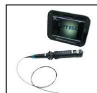
※工業用ビデオスコープ