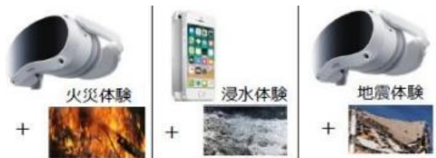
AR防災体験レンタルセット