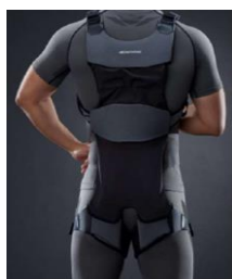
アシストスーツ 様々な現場作業での動作 をサポート