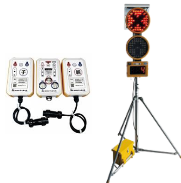
ソーラー式工事用信号機 工事現場での交通誘導信号機、 リモコン操作も可能