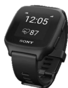
REC' sGAJUMARU 1人作業の安全を見守る スマートウォッチ