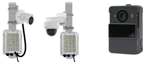
どこでも“me”RECカメラ 健康と安全を見守るカメラ