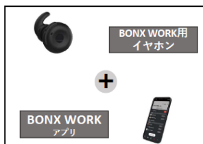
次世代トランシーバー 現場作業での通話を楽に